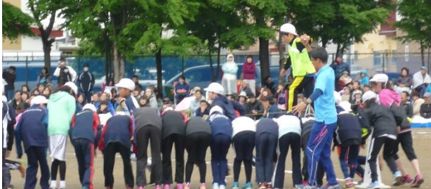
5年 明和いかだ下り