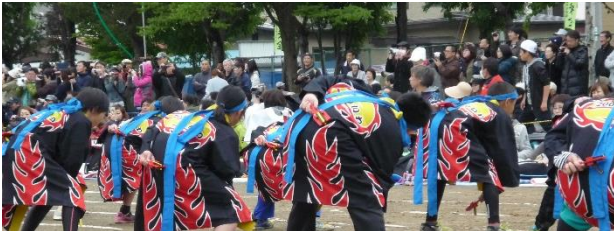
5・6年 明和よさこいソーラン2017