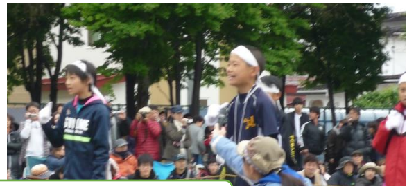
寒さを吹き飛ばす 元気いっぱいの応援合戦