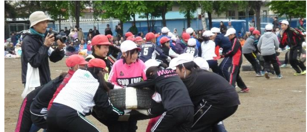
6年 激闘！タイヤ取り