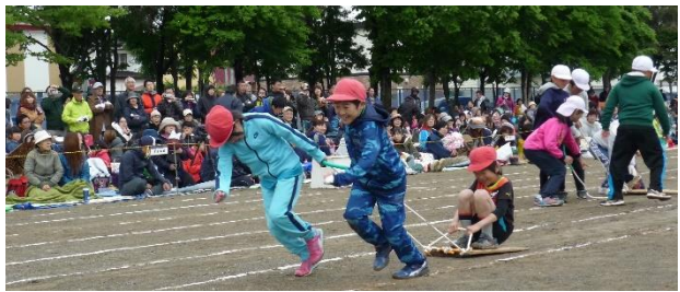
4年 走れ！明和ばんば