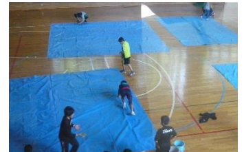
最後は6年生がしっかりと後片付けをしました