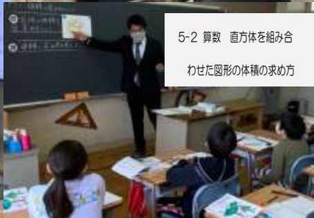
5-2 算数 直方体を組み合わせた図形の体積の求め方

第1回目の授業参観の様子です。今年度は1日1学級ずつ分散して開催しています。保護者の皆様にはお忙しい中、ご参観いただきありがとうございます。学級の様子については資料にてご確認ください、気になる点がありましたら面談等で担任にお伝えください。