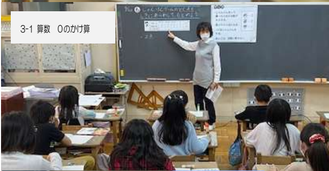
3-1 算数 0のかけ算