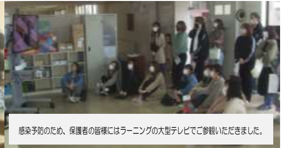
感染予防のため、保護者の皆様にはラーニングの大型テレビでご参観いただきました。