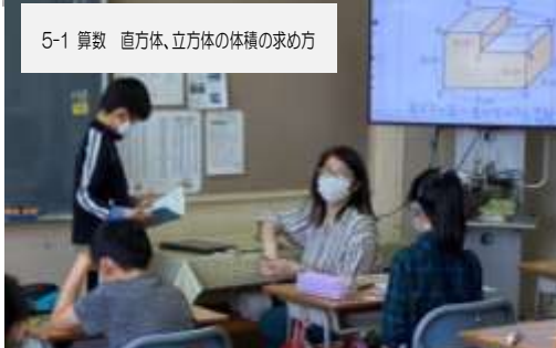
5-1 算数 直方体、立方体の体積の求め方