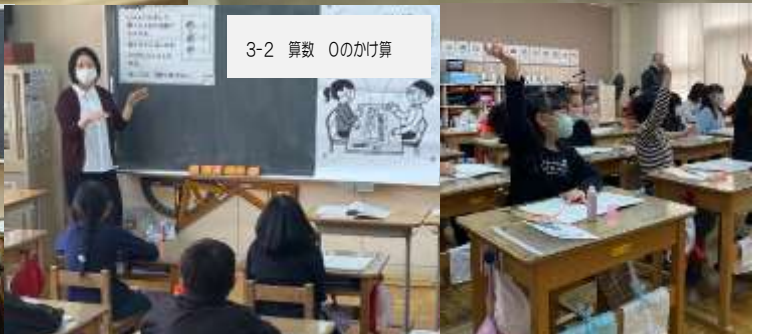
3-2 算数 0のかけ算