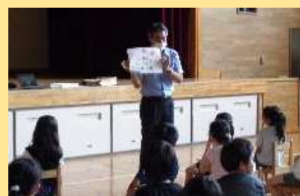
7月20日（火） 4年生 総合的な学習の時間の様子です。日本メキシコ学院の勤務経験がある教頭先生から外国の小学校について学習しました。