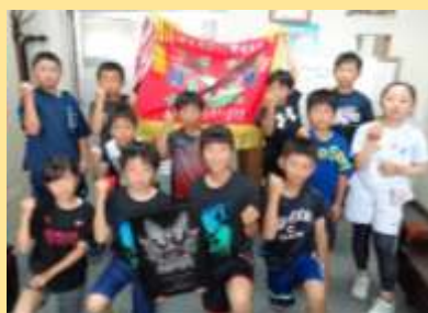
第39回 帯広ちびっ子 少年野球大会 優勝 明和ブルーサンダース