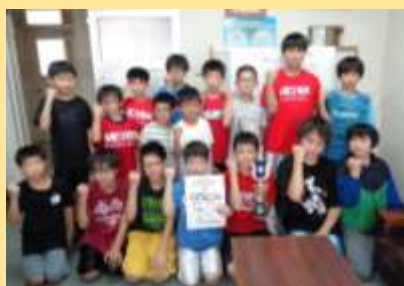
第42回 北海道ミニバスケットボール 夏季交歓大会+勝地区予選大会 男子 準優勝 帯広明和少年団