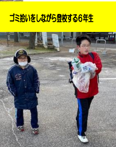
ゴミ拾いをしながら登校する6年生