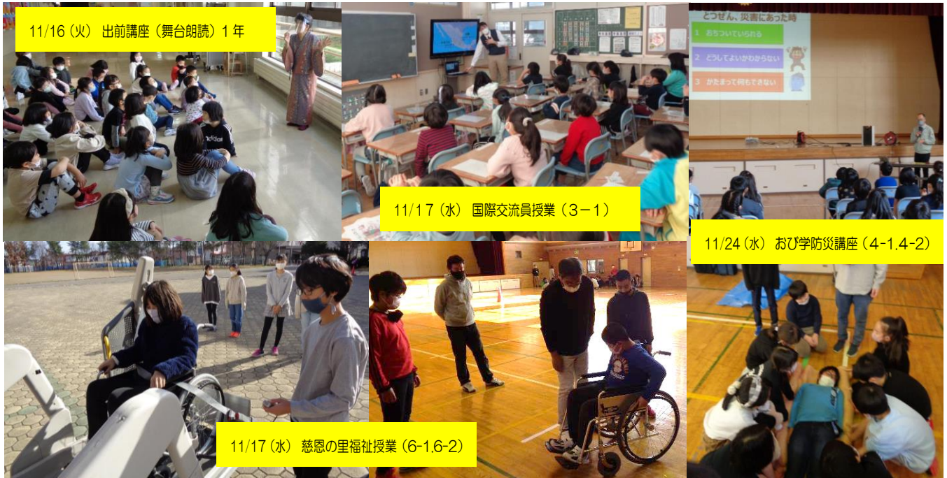
11/16 (火) 出前講座(舞台朗読)1年