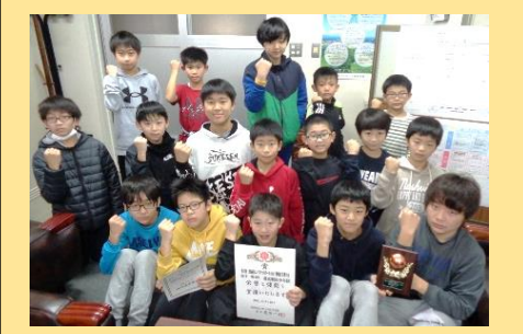
第47回 北海道ミニバスケットボール大会 十勝地区予選大会 男子 第4位 帯広明和少年団