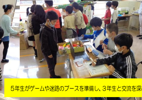
5年生がゲームや迷路のブースを準備し、3年生と交流を深めています。