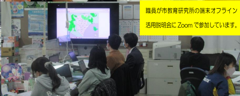
職員が市教育研究所の端末オフライン活用説明会に Zoom で参加しています。