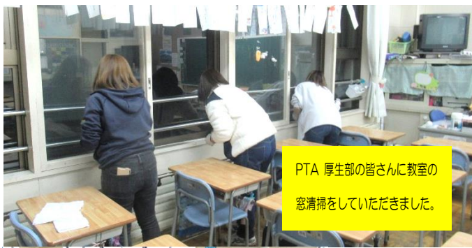
PTA 厚生部の皆さんに教室の窓清掃をしていただきました。