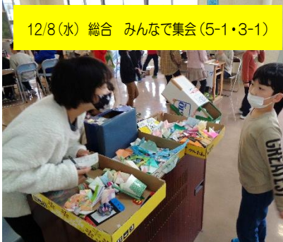
12/8(水) 総合 みんなで集会(5-1・3-1)