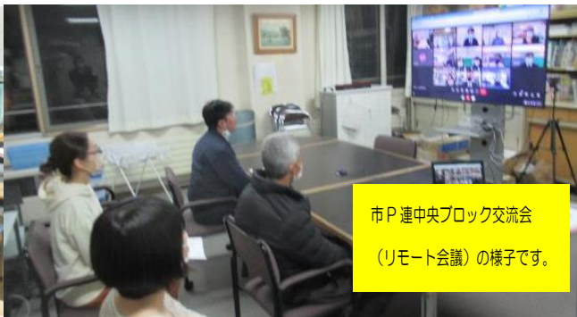
市P連中央ブロック交流会 (リモート会議) の様子です。