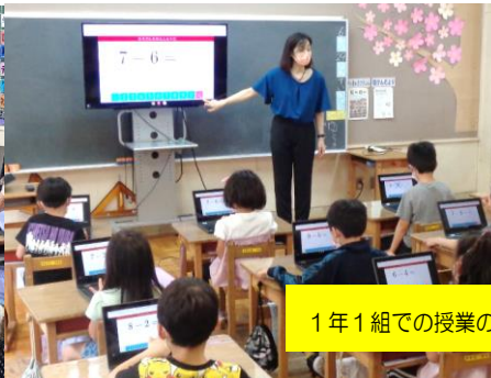
1年1組での授業の様子（算数）