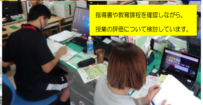
指導書や教育課程を確認しながら、授業の評価について検討しています。