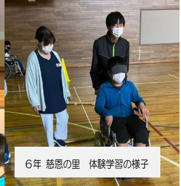
6年 慈恩の里 体験学習の様子