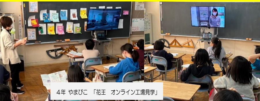
4年 やまびこ 「花王 オンライン工場見学」