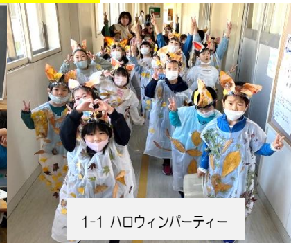
1-1 ハロウィンパーティー

11月2日(水)、4年生は花王和歌山工場とオンラインで繋がり、洗剤等の製品が出来る様子や環境への配慮などを学びました。1年生は、生活科で集めた落ち葉などをつかって衣装をつくり、ハロウィンパーティーを楽しみました。