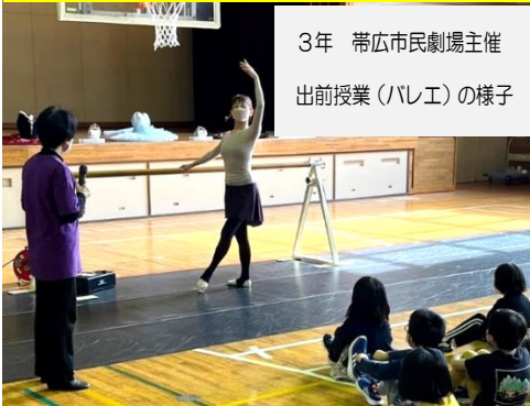
3年 帯広市民劇場主催 出前授業(バレエ)の様子