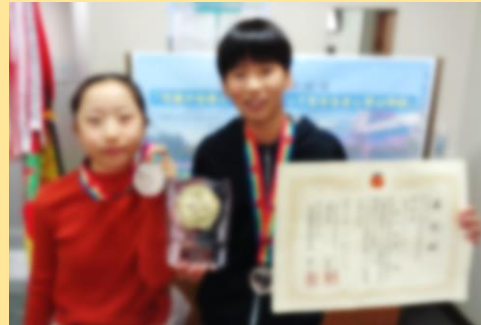
エスエスケイカップ 第27回 学童女子選抜大会 殊勲賞 とかちスマイルレインボー