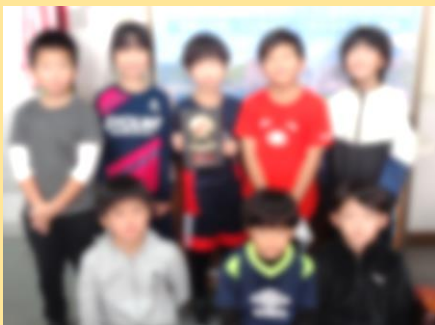
2022 第11回 U-9 フットサルリーグ Dブロック 優勝 明和広陽サッカー少年団