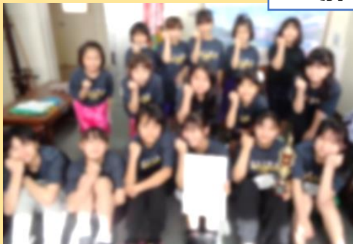
第48回 北海道ミニバスケットボール大会 十勝地区予選会 女子第4位 帯広明和少年団